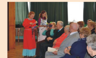
Igi i Fanny-karnawał u seniorów

2014 r. - ZCW otrzymało na 3 lata akredytację i status organizacji przyjmującej, wysyłającej i koordynującej Wolontariatu Europejskiego. W ramach EVS przez 14 miesięcy pracowali w Stowarzyszeniu Bułgarka, Hiszpanka, Włoch i Hiszpan.