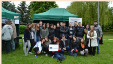
Międzynarodowe spotkanie: w Zamościu i w Busteni (Rumunia)

W latach 2013 – 2016, w ramach programów „Młodzi w działaniu”, Erasmus+ i PNWM były realizowane wielostronne przedsięwzięcia (wymiany, seminaria i kursy treningowe – 13 projektów) w których brała udział młodzież i koordynatorzy organizacji pozarządowych z 21 państw: Bułgarii, Czech, Chorwacji, Cypru, Estonii, Francji, Grecji, Gruzji, Hiszpanii, Izraela, Litwy, Łotwy, Mołdawii, Niemiec, Portugalii, Rumunii, Słowacji, Turcji, Ukrainy, Węgier i Włoch. Udział wolontariuszy z Polski w tych projektach (miejscowych i wyjazdowych) był formą nagrody za ich pracę i zaangażowanie.