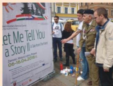
Happening projektowy na Rynku Wielkim

Projekty historyczne: „Let me tell you a story I” - o Dzieciach Zamojszczyzny i „Let me tell you a story II” o partyzantach i Powstaniu Zamojskim zostały uznane w 2016 roku przez Agencję Narodową za „best practices” - najlepsze w programie Erasmus+.