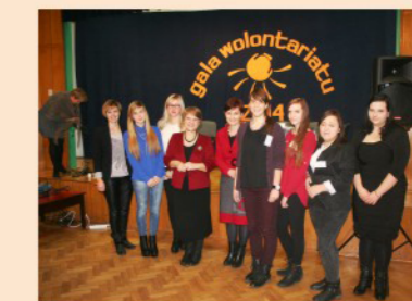
Wolontariusze z I LO