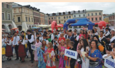
Festiwal Romski w Zamościu

W roku 2015 – ZCW było partnerem w polsko – rumuńsko – węgiersko – słowackim projekcie poświęconym kulturze i tożsamości Romów, sfinansowanym przez unijny program „Europa dla obywateli”.